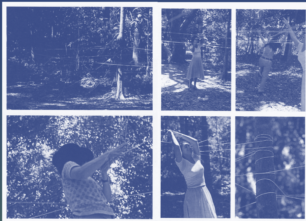
Ttéia Parque Lage, 1978-1979

Nos anos de 1978/79, em colaboração com os artistas que eram seus alunos, Lygia Pape – professora da Escola de Artes Visuais do Parque Lage na década de 70 – realizou, na floresta na qual a EAV se encontra, o projeto Teteia. Se, quando vista nas fotografias que a documentam, a Teteia se comporta como uma espécie de instalação em meio à mata, é necessário frisar que, para a artista e seus colaboradores, importava menos sua dimensão escultórica do que o processo de sua criação.